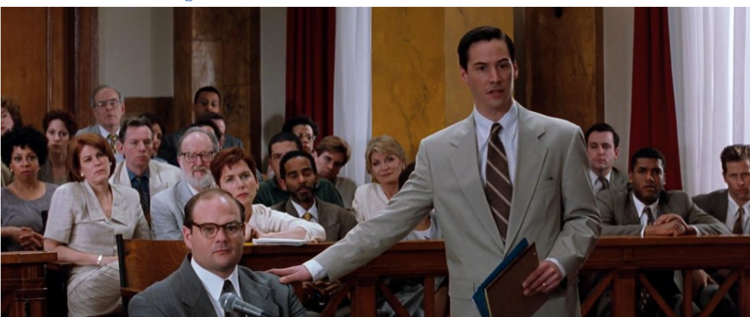
Figura 3: Kevin Lomax (interpretado por Keanu Reeves) representa em tribunal o arguido acusado de abusar sexualmente de uma das suas alunas.