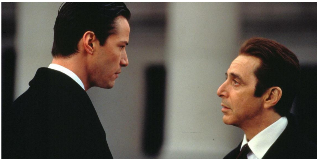
Figura 4: Kevin Lomax (Keanu Reeves) e John Milton (Al Pacino).

- “Yes. Your defense was brilliant. You saw the weak spots in the prosecution’s case and you surged forward, concentrating on them.” “I knew the principal had it in for her and I knew the other little girls were lying . . .” “Yes,” John Milton said, leaning forward, his arms extended over the desk as if he wanted to embrace Kevin. “But you also knew Barbara Stanley was not lying and that Lois Wilson was guilty.” Kevin just stared. “Oh, you weren’t completely sure, but in your heart you thought she had abused Barbara Stanley and that Barbara Stanley, afraid to come forward by herself, worked her friends into a frenzy and got them to join her. That idiot principal was anxious to get the teacher . . .” “I don’t know all that for sure,” Kevin said slowly. “It’s all right,” John Milton said, smiling again. “You did what you had to do as her advocate.”