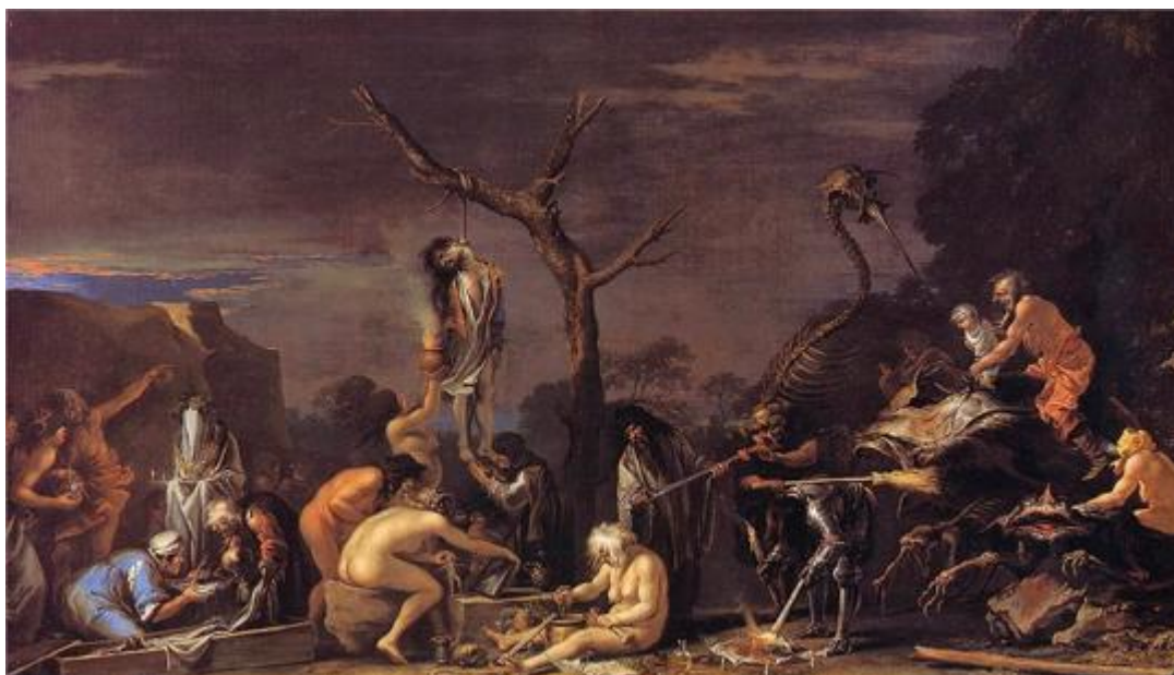
Figura 5 - “Witches and their Incantations”, Salvator Rosa 1646

“Witches and their Incantations” ( Figura 5 ) é outro exemplo de uma pintura que aborda o tema da caça às bruxas. Neste quadro, os feitiços são lançados no centro, debaixo de um homem enforcado numa árvore murcha. Pode ainda denotar-se do lado direito um esqueleto, que parece ser de um dinossauro, e ainda um cavaleiro e uma pessoa com um bebé nos braços. Ao centro sobressai uma bruxa remexendo um caldeirão, mais vez representada nua, e, do lado direito, é representado um escrivão a assinar um documento, entre outras figuras. O primeiro plano, brilhantemente iluminado, é contrastado com a paisagem nocturna atrás.