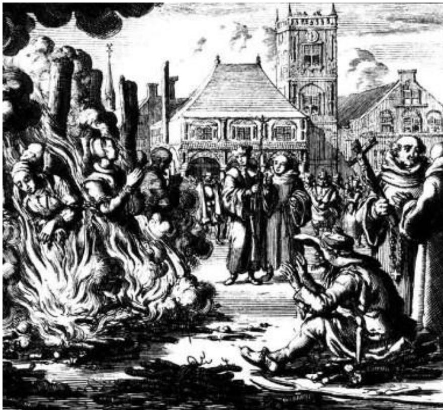
Figura 2 - Julgamento de uma bruxa, autor desconhecido