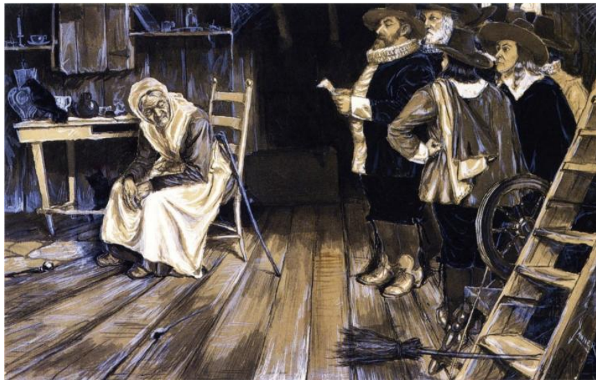
Figura 7 - "The Witch Hunt", Henry Ossawa Tanner, 1888

pássaro preto e certos recipientes fumegantes. Não sendo exceção relativamente às pinturas anteriormente tratadas, as cores escuras estão em predomínio nesta obra de arte.