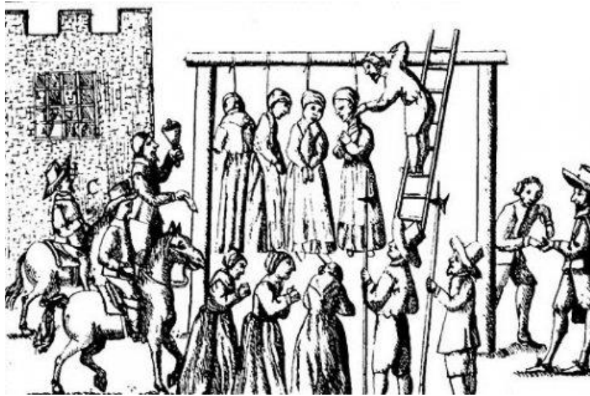
Figura 3 – Execução de bruxas, autor desconhecido

Nalguns casos as condenadas eram enviadas para a prisão ( Figura 4 ), ficando numa cela onde poderiam ser sentenciadas a passar fome e sede por algumas horas ou dias, ou meses, para que, através desse sofrimento, as supostas infratoras decidissem confessar. A prisão, embora com diversos objetivos, foi uma pena que perdurou e, como sabemos, é atualmente utilizada como sanção à prática de crimes e como prevenção perante determinados perigos 2 .