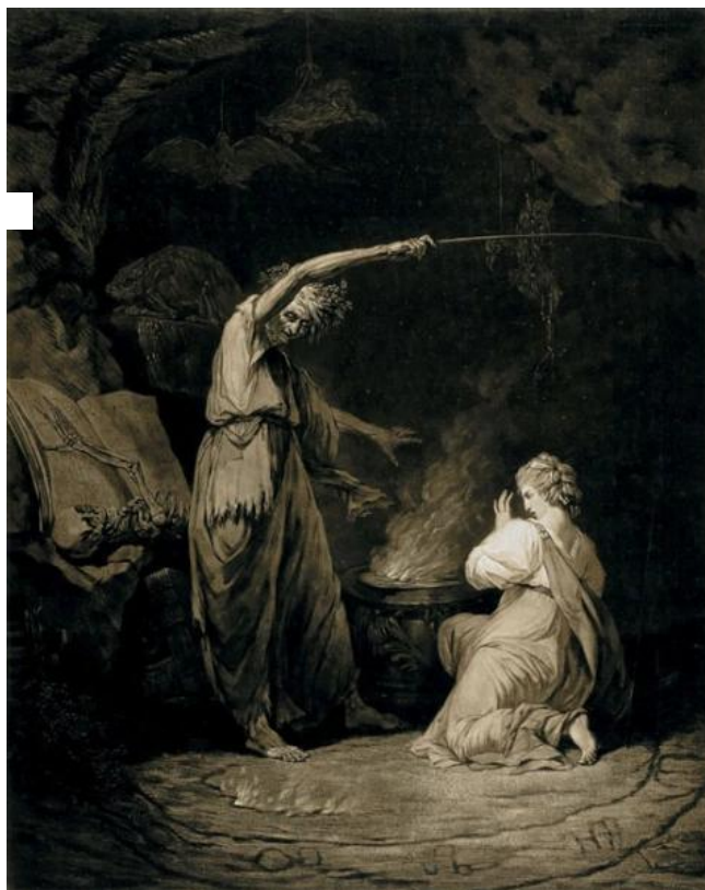
Figura 6 - "An Incantation", John British Dixon, 1773

ambiente sombrio, mas com iluminação ao centro, tentando que o mal fosse rodeado pela escuridão ou pela penumbra atacando a luz ou a pureza alva.