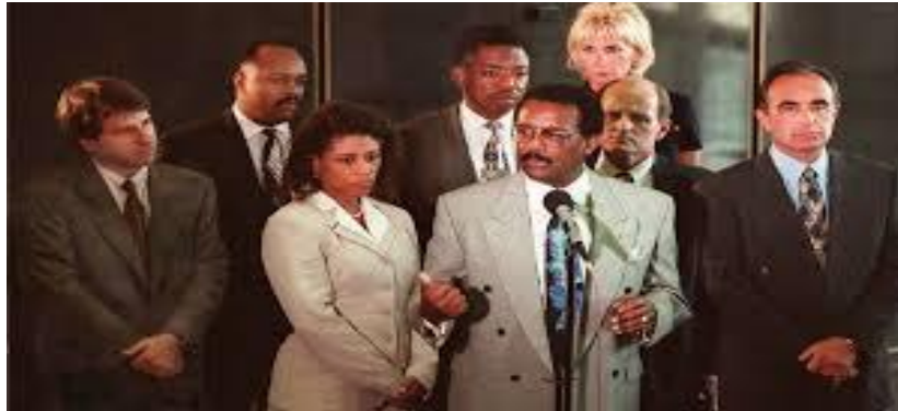
Figura 5 – “Dream Team”.

e, sem ter uma obrigação de resultado, não deixaram os seus créditos por mãos alheias.