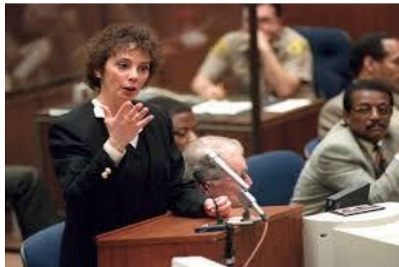
Figura 6 – Marcia Clark.

Na acusação estavam a promotora Marcia Clark e o advogado Christopher Darden.