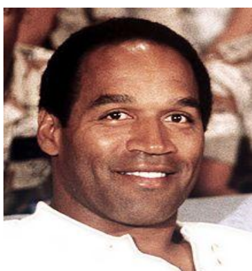
Figura 1 – O.J. Simpson

Orenthal James Simpson , nasceu em São Francisco, no dia 9 de julho de 1947. Mais conhecido como O.J. Simpson , ou como “ The Juice ”, é um ex-jogador de futebol americano. O.J. estreou-se enquanto jogador, em 1969, pelo Buffalo Bills e jogou pela última vez em 1979, pelo San Francisco 49’ers.