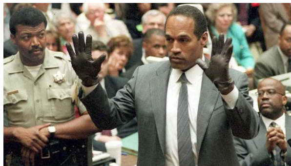
Figura 8 – O.J. experimenta a luva em tribunal.

Frisando a existência de racismo por parte de Mark Fuhrman, comparou o caso à campanha de Hitler contra os judeus. Refere ainda que quando pediram a O.J. que experimentasse a luva, a luva não serviu porque não era dele. Usou seguidamente a expressão, “If it doesn’t fit, you must acquit” isto é, se não cabe na mão, deve haver absolvição .