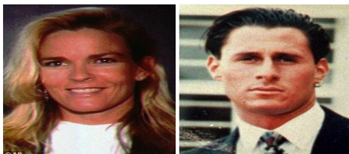
Figura 2 – Nicole Brown Simpson e Ronald Goldman.

O caso de O.J. Simpson (The People vs O.J. Simpson), remonta-nos aos anos 90, nos Estados Unidos, mais precisamente ao dia 12 de Junho de 1994, dia em que Nicole Brown Simpson e Ronald Goldman foram encontrados assassinados entre as 22h e as 23h à porta de casa de Nicole, em Brentwood, Los Angeles.