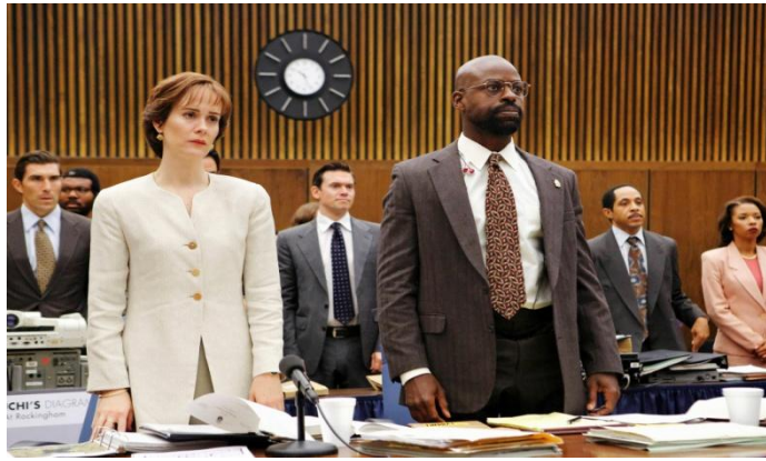
Figura 7 – Os actores Sarah Paulson e Sterling K. Brown interpretam, nesta série, as personagens da procuradora Marcia Clark e do advogado Christopher Darden, respectivamente.

Johnnie Cochran, nas alegações finais do julgamento, alertou para o facto de ter sido Mark Fuhrman, um mentiroso, um polícia que disse que fazia de tudo para punir homens negros, quem encontrou a luva. Frisando que Mark não era apenas um agente, pois ele representava toda a polícia de Los Angeles.