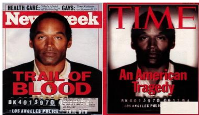
Figura 4 – O caso de O.J. Simpson na imprensa americana.

Gerou muita polémica, discussão e curiosidade dentro e fora do tribunal. Foi considerado o julgamento do século passado, um dos maiores escândalos dos anos 90, um exemplo de falhas na investigação e foi certamente o caso policial e judicial que teve maior publicidade na recente história da América contemporânea.